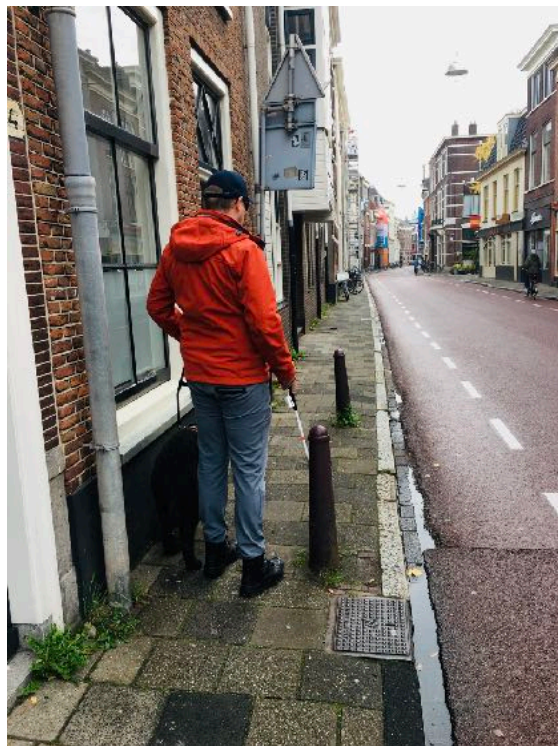
Paaltjes in de stoep