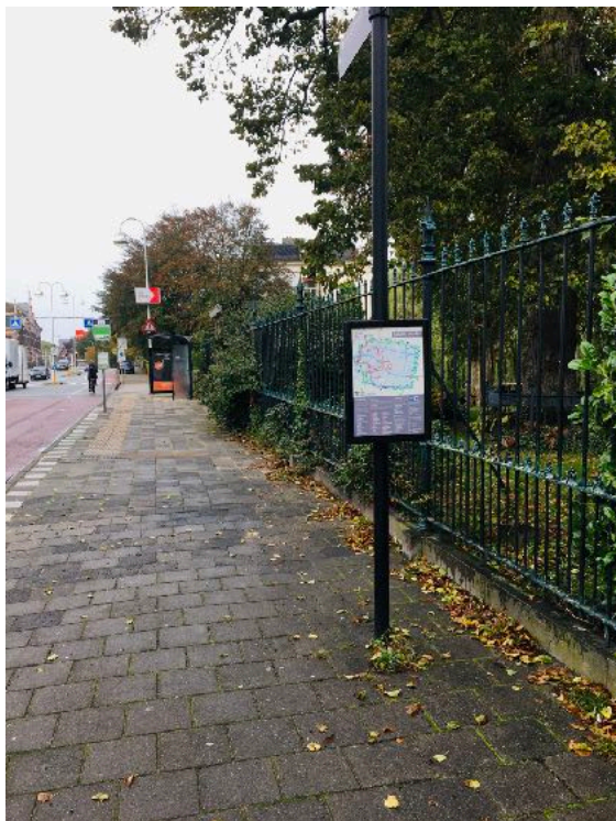
Paal met bord

Op de stoep in het smalle gedeelte staan twee paaltjes. De stoep wordt niet breder. Dit zijn obstakels voor mensen met een beperking. Komen deze palen straks weer terug?